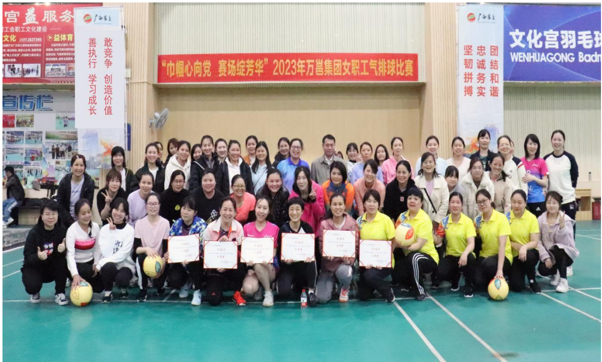
(公司组织“巾帼心向党 赛场绽芳华”气排球比赛)