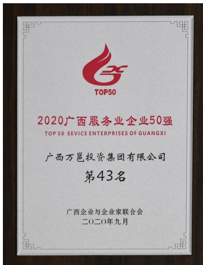
(2020年公司荣获广西服务业企业50强)