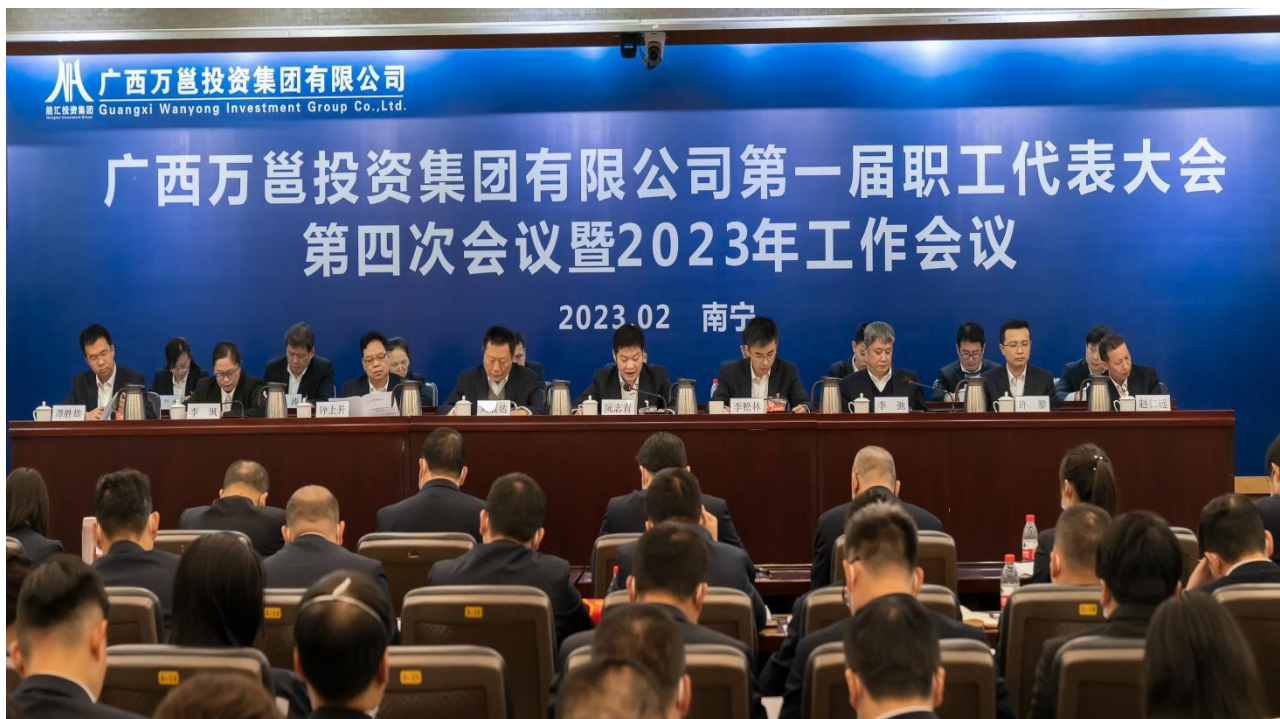
(公司召开一届四次职代会暨 2023 年工作会)