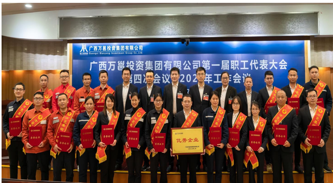
(公司领导与先进代表合影)