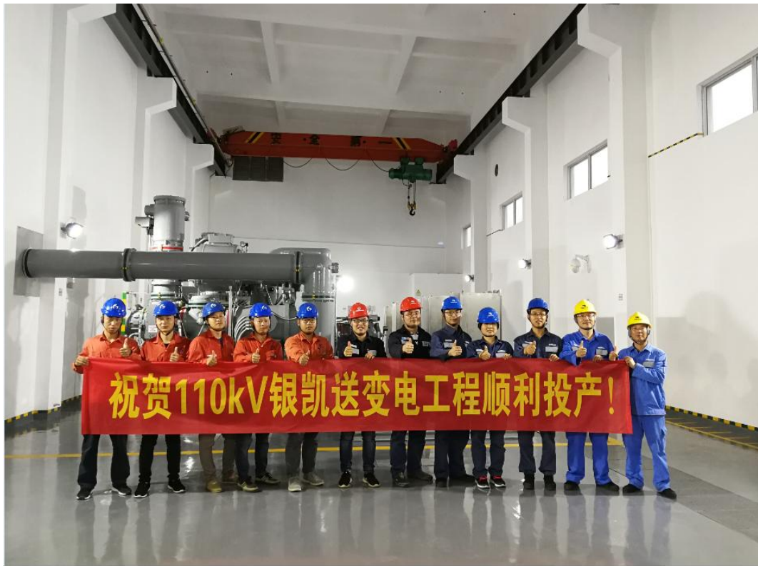
(中国南方电网 2019 年度优质工程奖：110kV 银凯变电站工程)