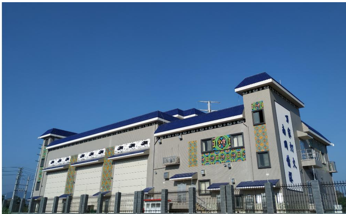
（中国南方电网 2019 年度优质工程奖：110kV 石林变电站工程）