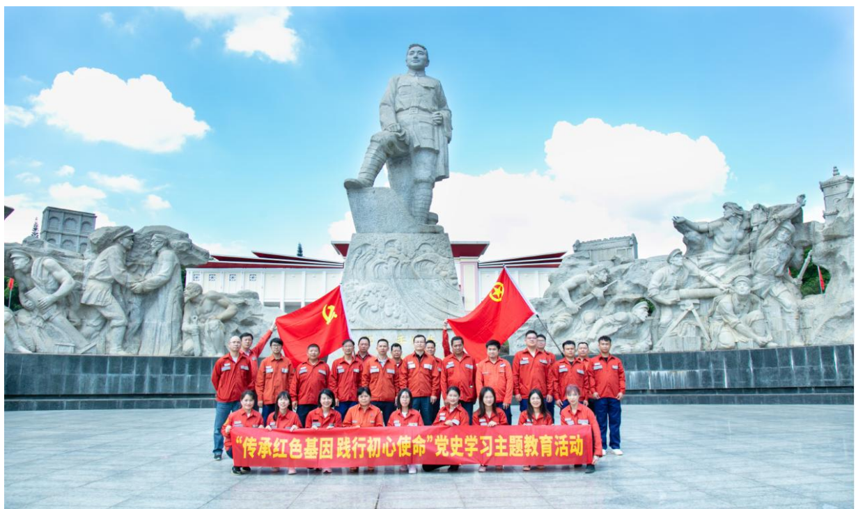
(党支部开展学习党史主题教育活动)