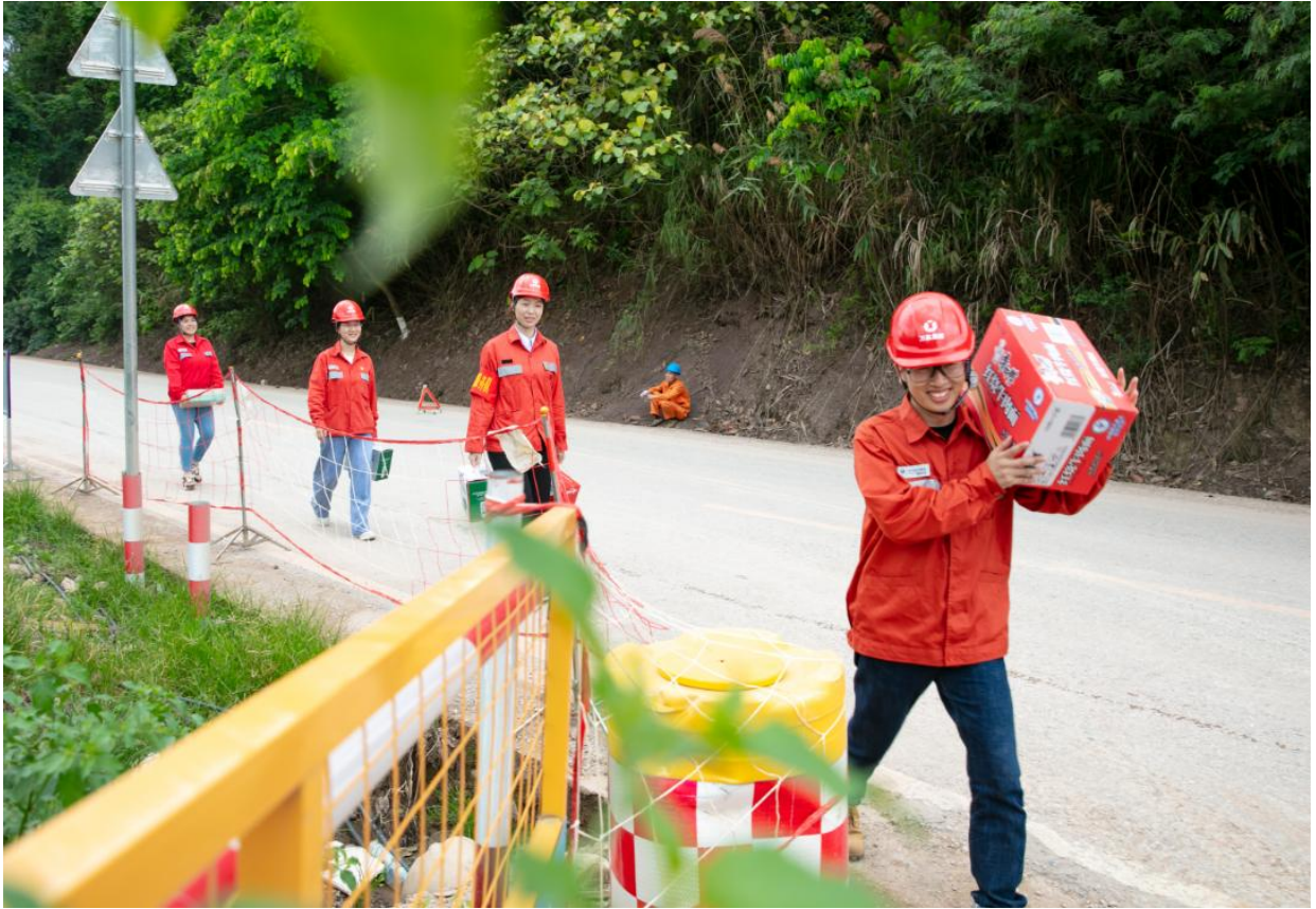
(公司工会到一线工地进行慰问)